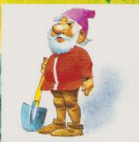
AL DOILEA PITIC