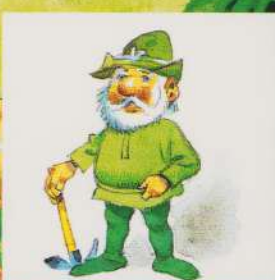
AL ȘASELEA PITIC