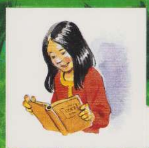
ALBĂ CA ZĂPADA