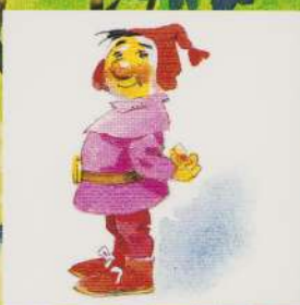
AL PATRULEA PITIC