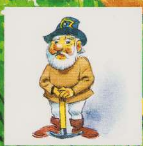
AL ȘAPTELEA PITIC