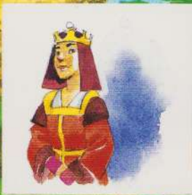
REGINA CEA REA