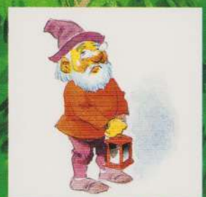
AL CINCILEA PITIC