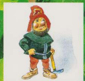
AL TREILEA PITIC